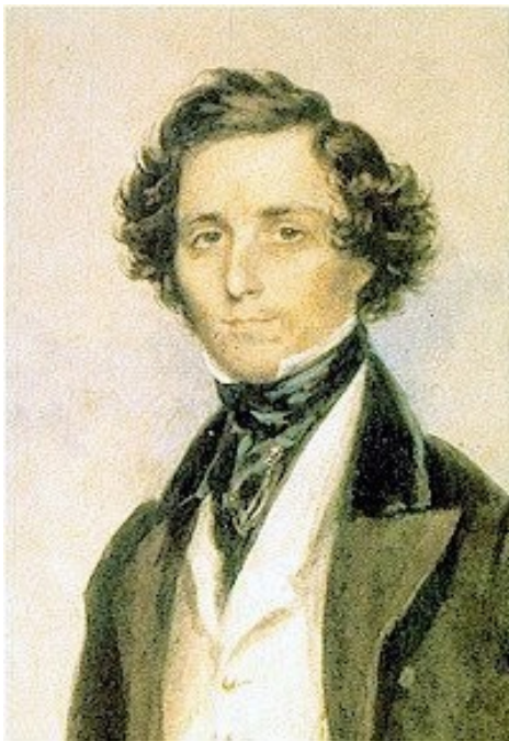
afbeelding 6: Mendelssohn

Leipzig wordt nog meer een centrum voor de Romantische generatie als Mendelssohn zich er in 1835 als dirigent vestigt en er in 1843 zijn beroemde conservatorium sticht. Leipzig wordt het middelpunt van de Leipziger school. Buitenlanders als Gade en "onze" Verhulst stromen toe. De boel wordt wel steeds conservatiever. Over Schumanns verhouding tot Mendelssohn is veel geschreven, vaak in negatieve zin. Door Mendelssohn zou Schumann zijn jeugdig vuur hebben ingeleverd voor een dor classicisme. Het is de vraag of dat zo is. Schumann wist heel goed waar hij stond. Hij oefent zeker kritiek uit op Mendelssohn, die hij "de Mozart van de 19de eeuw" noemt. Een mooie uitspraak denk je dan, maar het is een uitspraak vol kritiek! Beethoven was immers Schumanns held: daar zat hem de vernieuwing van de muziek. Typerend ook (ook als je bedenkt dat Schumann zelf als dirigent mislukte, juist omdat hij niet autoritair wilde zijn): zijn kritiek op Mendelssohn als een van de eerste dirigenten die met stokje dirigeerde.