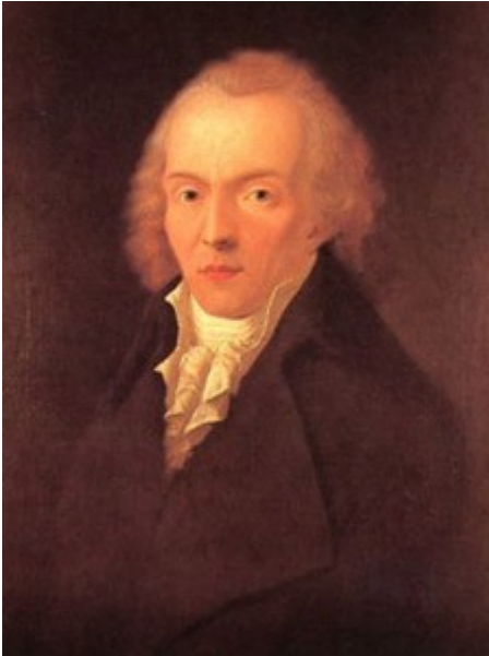
afbeelding: Jean Paul rond 1798

Wonderlijke man! Heerlijke, maar moeilijke tovenaars met woorden! Estheet! Wat zijn je boeken moeilijk: een doolhof is het meestal, je buitelt over je eigen woorden! Je bent voor velen in je tijd: gids, leidsman, idool. Je zoekt het absolute, vindt het banale: beschrijft zo'n beetje alle romantische problemen. Je kent daverende humor, maar ook mystiek, eenvoud. Gruwelijk verhaal staat naast de idylle. Het sentimentele staat naast een overtuigend anti-militairisme. En overal zingt de natuur. Je esthetische opvattingen hebben de nodige invloed gehad, al kon Goethe je dan niet uitstaan. Je introduceerde de verhalen van Hoffmann. En: hoeveel musici kwamen niet onder jouw bekoring? Schreef Mahler niet zijn eerste symfonie onder de indruk van jouw roman "Titan"?