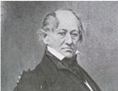
afbeelding 3: Friedrich Wieck

die hij al kende uit zijn Leipziger studententijd. Ex-theoloog en pianohandelaar. Matig componist. De grootste pianopaedagoog van zijn tijd. Gaf behalve Clara en Schumann ook o.a. Hans von Bülow les. Koude kikker, dat wel. Streng, uiterst gedisciplineerd, eigenschappen die Schumann in deze tijd best wel kon gebruiken. Maar ook mateloos arrogant: als Schumann alleen maar iets bewonderends van Hummel durft te zeggen! Gescheiden van zijn vrouw. Alles opofferend voor zijn glorie en trots: