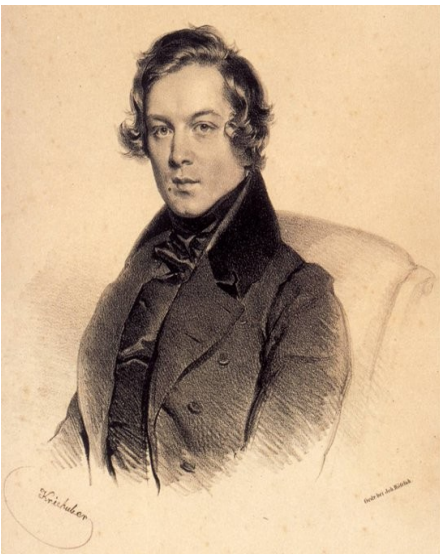
afbeelding 1: Schumann in 1839