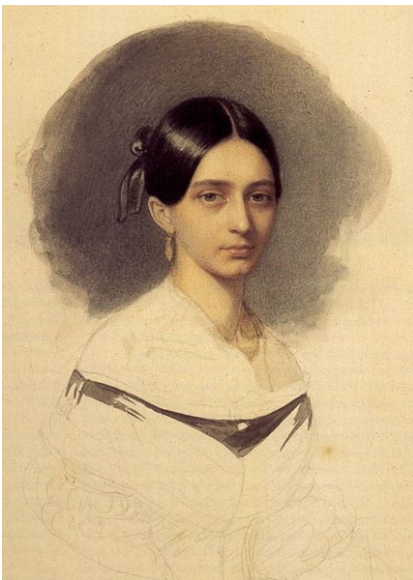
afbeelding 5: Clara Wieck in 1840

Zijn briljant dochtertje met de grote ogen, dat hij weet te maken tot de grootste pianist van haar tijd. Negen jaar oud is ze als Schumann haar voor het eerst ziet (te grote ogen, rare neus, vindt hij...). Te jong dus nog om als vrouw indruk te maken, maar dat zal spoedig veranderen. Clara is ook een componiste van niet onaanzienlijk formaat: al op 11-jarige leeftijd worden haar eerste composities gepubliceerd. Haar op 14-jarige leeftijd gecomponeerde pianoconcert (Schumann hielp haar later bij de orkestratie) oefende nog invloed uit (cello-solo) op het tweede pianoconcert van Brahms. Streng, zeer streng is vader Wieck, die haar vormt en plooit naar zijn normen. Een eigen leven heeft ze niet, ze wordt nog strenger bewaakt dan Rosina. Streng zijn ook de muzikale normen: géén vertrassing, weinig virtuoze flauwekul, geen Parijse toestanden à la Liszt (die ze dan ook zal haten!), maar eerlijke Duitse kost (in Clara's brieven vinden we enige aanvalletjes van vreemdelingenhaat en antisemitisme): Beethoven en wat later Bach. Het zal het publiek niet altijd behagen, maar wel direct het "handelsmerk" van Clara worden.