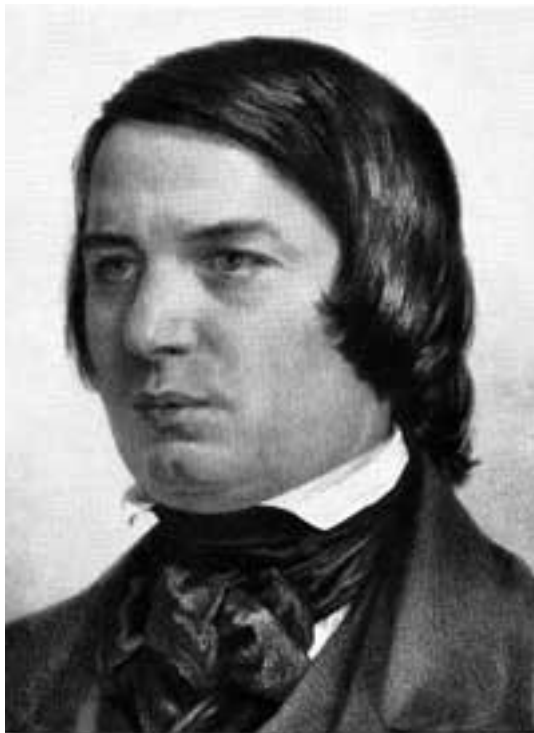
Afbeelding 5: Bij Schumann en zijn vriend Brahms stop Wittgensteins muzikale belangstelling

'Een schilderij van een volledige appelboom, hoe accuraat ook, lijkt er in een bepaalde zin oneindig veel minder op dan het kleinste madeliefje. En in deze zin is een symfonie van Bruckner oneindig nauwer gerelateerd aan een symfonie uit de heroïsche periode dan een van Mahler. Als deze laatste een kunstwerk is dan is het er een van een totaal andere soort.' 5