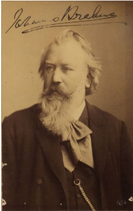
Afbeelding 2: Brahms was docent van de Wittgensteins en als componist in aanzien bij Ludwig